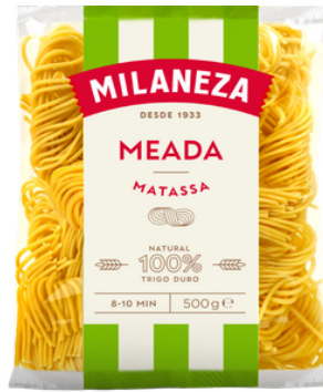
PATES MEADA 500G MILANEZA