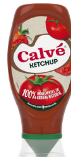
KETCHUP CALVE TOP DOWN 275G