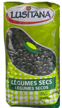
HARICOT NOIR SEC LUSITANA 1KG