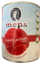
TOMATES PELEES 780G MEPS