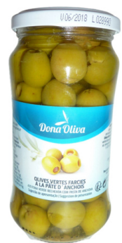
OLIVES VERTES FARCIES A LA PATE D'ANCHOIS 200g DONA OLIVA