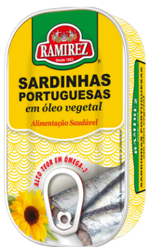
SARDINE HUILE VEGETALE 125G RAMIREZ