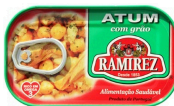
SALADE DE THON AUX POIS CHICHE 120G RAMIREZ