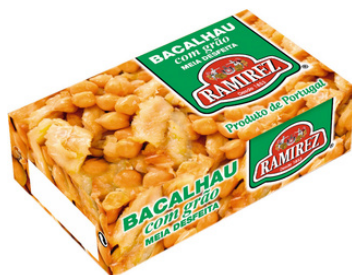
MORUE ET POIS CHICHE A HUILE OLIVE EXTRA VIERGE 120G RAMIREZ