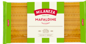
PATES TALHARIM 500G MILANEZA