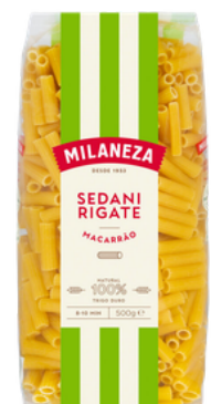
PATES MACARRAO SEDANI RIGATE 500G MILANEZA