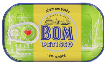
THON A L'HUILE D'OLIVE BOM PETISCO 120G x 50