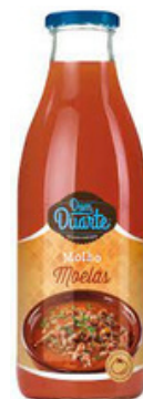
SAUCE POUR GESIERS DOM DUARTE 500 G