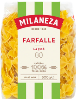
PATES LACOS MILANEZA 500GR