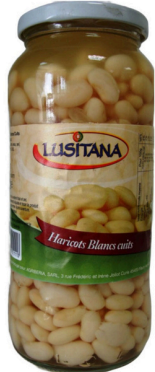
HARICOTS BLANCS CUIITS 400G LUSITANA