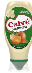
MAYONNAISE CALVE TOP DOWN 240G