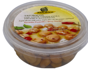
S AVEC HUILE D'OLIVE, PIMENT PIQUANT ET BASILIC BARQ.PLASTIQUE 150G