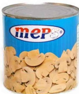
CHAMPIGNON DECOUPES MEPS 780G