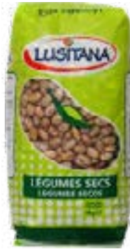
HARICOT COCO ROSE SEC LUSITANA 1 KG