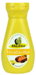
MOUTARDE 250g MACARICO