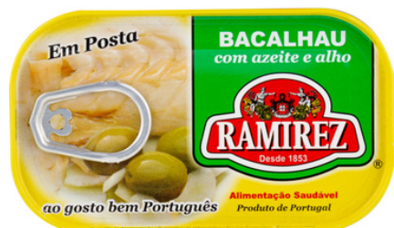
MORUE HUILE D'OLIVE ET AIL 120G RAMIREZ