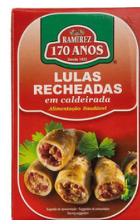
CALAMAR FARCI A LA PORTUGAISE RAMIREZ 115G