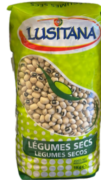
HARICOT CORNILLE SEC LUSITANA 1 KG