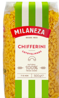
PATES COTOVELINHOS (COQUILLETTE) 500G MILANEZA