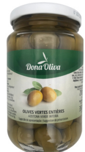
OLIVES VERTES ENTIERES 210g DONA OLIVA