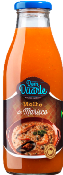
SAUCE POUR RIZ FRUITS DE MER 500G DOM DUARTE