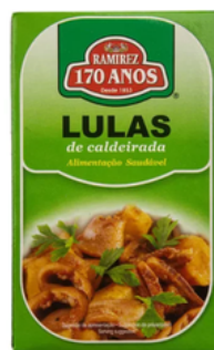
CALAMAR A LA PORTUGAISE RAMIREZ 115G