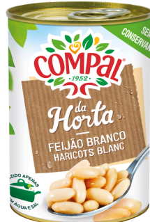
HARICOT BLANC CUIT COMPAL 410G