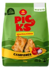
BISCUIT PICKS COUNTRY 150G VIEIRA DE CASTRO