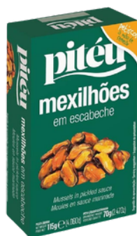
MOULES SAUCE MARINADE ESCABECHE PITEU 115G X 16 MEXILHOES