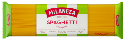
PATES SPAGHETTI 500G MILANEZA