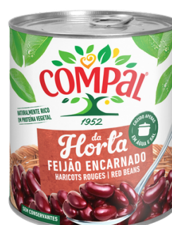
HARICOT ROUGE CUIT COMPAL 410G