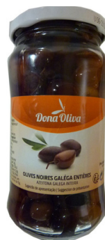
OLIVES GALEGA ENTIERES 210g DONA OLIVA