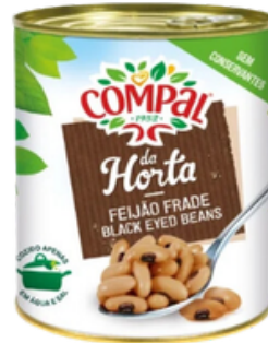
HARICOTS CORNILLES 845 GRS COMPAL