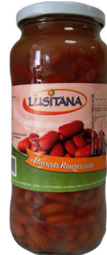
HARICOTS ROUGES CUIITS 400G LUSITANA