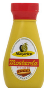
MOUTARDE PIQUANTE 250g MACARICO