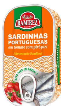
SARDINE TOMATE PIQUANTE 125g RAMIREZ