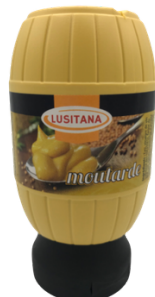
MOUTARDE LUSITANA 270G