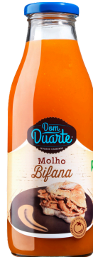
SAUCE POUR BIFANAS DOM DUARTE 500 G