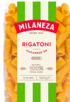
PATES MACARRAO GR RIGATONI 500G MILANEZA