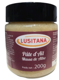
PATE D'AIL 200G LUSITANA