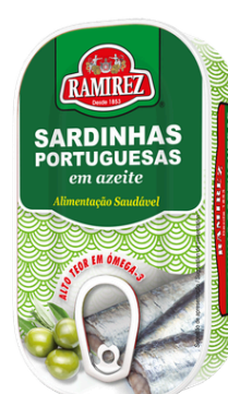
SARDINE HUILE OLIVE 125G RAMIREZ