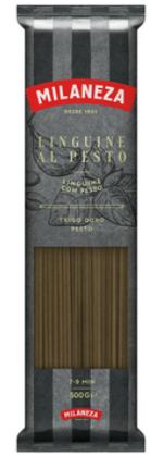
PATES LINGUINE AL PESTO 500G MILANEZA