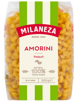
PATES ONDAS MILANEZA 500GR