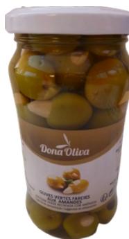
OLIVES VERTES FARCIES AUX AMANDES 200g DONA OLIVA