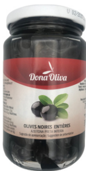
OLIVES NOIRES ENTIERES 210g DONA OLIVA