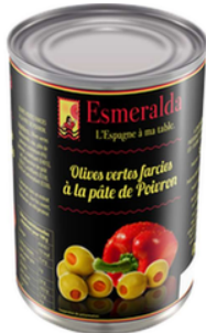
OLIVES VERTES FARCIES AU POIVRON 120G ESMERALDA