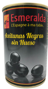
OLIVES NOIRES DENOYAUTEES 115G ESMERALDA