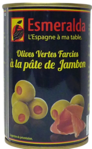
OLIVES VERTES FARCIES AU JAMBON 120G ESMERALDA