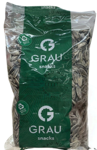
GRAINES DE TOURNESOL GRILLEES ET SALEES 250G GRAU