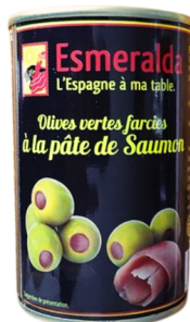
OLIVES VERTES FARCIES A LA PATE DE SAUMON 120 G ESMERALDA