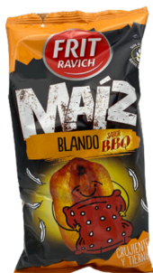
MAIS BLOND GRILLE BARBECUE 115G FRIT RAVICH