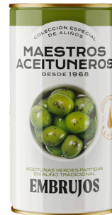
OLIVES VERTES AVEC NOYAU AUX ÉPICES 185G M. ACEITUNEROS