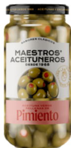
OLIVES FARCIES AU POIVRON 170G M. ACEITUNEROS