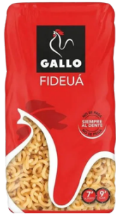
PATES FIDEUA 450G GALLO