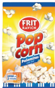
POP CORN MICRO ONDABLE FRIT RAVICH