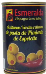
OLIVES VERTES FARCIES AU PIMENT D'ESPELETTE 120 G ESMERALDA