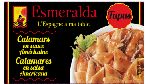
CALAMAR SAUCE AMERICAINE 120G ESMERALDA