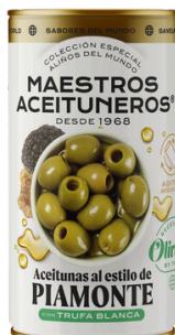
OLIVES DÉNOYAUTÉES ASSAISONNÉES - TRUFFE ET À L'HUILE D'OLIVE EXTRA VIERGE 150G M. ACEITUNEROS