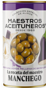
OLIVES VERTES FARCIES À L'AUBERGINE 150G M. ACEITUNEROS