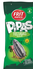
PIPAS GRILLEES 130G FRIT RAVICH