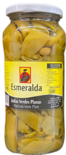
HARICOT VERT PLAT 535G (JUDIA VERDE) ESMERALDA