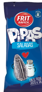
PIPAS SALEES 130G FRIT RAVICH