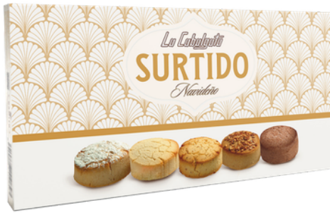
ESTUCHE SURTIDO NAVIDENO 300G LA CABALGATA