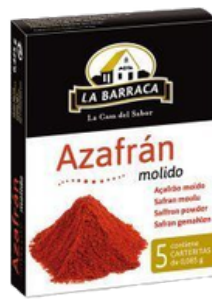
SAFRAN MOULU 5 X 0.085G LA BARRACA