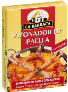
ASSAISONNEMENT POUR PAELLA AVEC SAFRAN 3 X 3G LA BARRACA