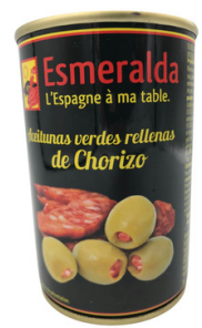
OLIVES VERTES FARCIES A LA PATE DE CHORIZO 120 G ESMERALDA