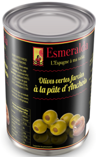
OLIVES VERTES FARCIES AUX ANCHOIS 130G ESMERALDA