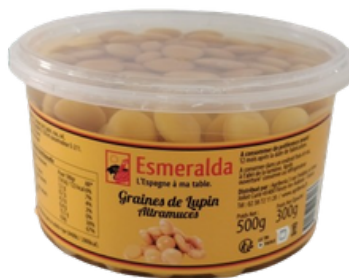
LUPINS 12/13 - BARQ 300G - ESMERALDA