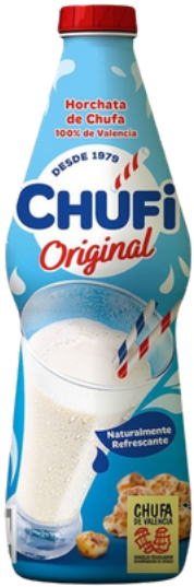
HORCHATA CHUFA CHUFI BILLE PLASTIQUE IL