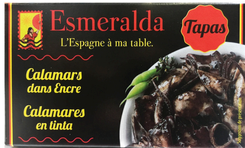
CALAMAR A L'ENCRE 120G ESMERALDA