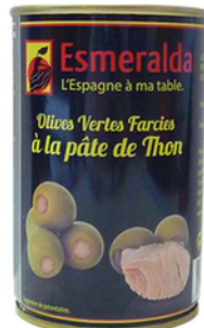
OLIVES VERTES FARCIES AU THON 120G ESMERALDA