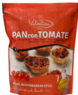
PAIN GRILLE A LA TOMATE ET A L'ORIGAN 150G VALENTINA