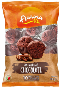
MADELEINE CHOCOLAT 420G AURORA