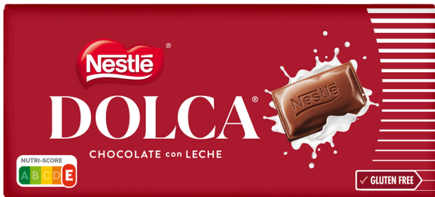
TABLETTE CHOCOLATAU LAIT DOLCA 100G NESTLE