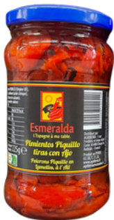
POIVRONS PIQUILLOS ROUGES A L AIL EN LAMELLES 290G ESMERALDA