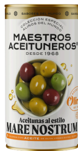
OLIVES DE TROIS COULEURS ASSAISONNÉES À L'HUILE D'OLIVE 185G M. ACEITUNEROS