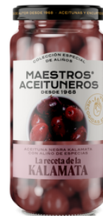
OLIVE NOIRE RECETTE "KALAMATA" AUX ÉPICES 190G M. ACEITUNEROS