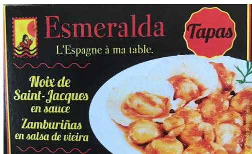
NOIX DE COUILLES ST JACQUES EN SAUCE 116G ESMERALDA