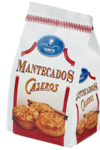
BOLSA MANTECADO CASEROS 200 G DULCES GAMITO