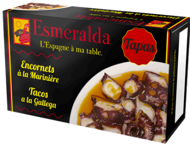
ENCORNET A LA MARINIERE 120G ESMERALDA