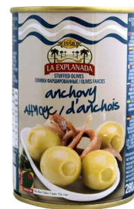
OLIVES FARCIES AUX ANCHOIS 120G LA EXPLANADA