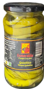
PIMENTS GUINDILLAS 285G ESMERALDA