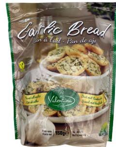
PAIN A L'AIL 150G VALENTINA