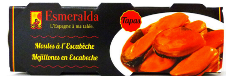
MOULES A L'ESCABECHE PREMIUM 3 X 78 G ESMERALDA