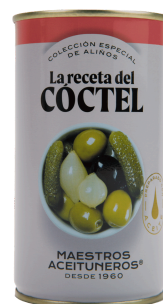
LE COCKTAIL D'OLIVES 170G M. ACEITUNEROS