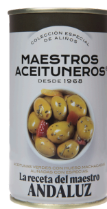
OLIVES VERTES A L'ANDALOUSE 185G M. ACEITUNEROS