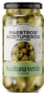
OLIVE VERTE MANZANILLA DÉNOYAUTÉE 1160G M. ACEITUNEROS