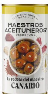
OLIVES VERTES ASSAISONNÉES À L'HUILE ET AUX ÉPICES 185G M. ACEITUNEROS