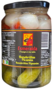
BANDERILLAS PIQUANTES 295G ESMERALDA