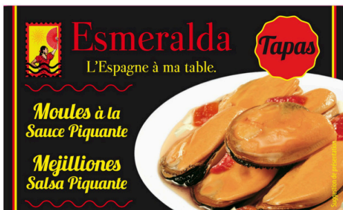
MOULES SAUCE PIQUANTE 116G ESMERALDA