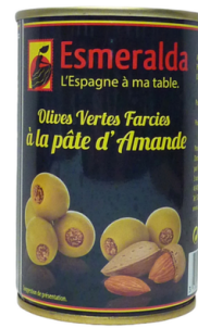
OLIVES VERTES FARCIES AUX AMANDES 120G ESMERALDA