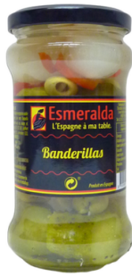
BANDERILLAS DOUCES 160G ESMERALDA