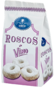
BOLSA ROSCOS DE VINO 200G DULCES GAMITO