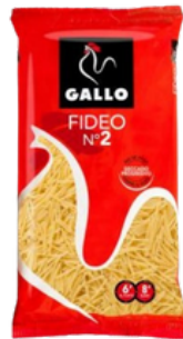
PATES FIDEO N°2 250G GALLO