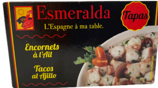
ENCORNET A L'AIL 120G ESMERALDA