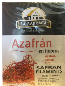
SAFRAN (FILAMENT) 5 X 0,085G LA BARRACA