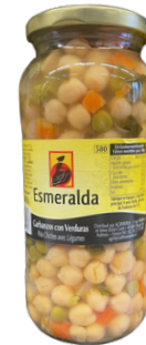
POIS CHICHES AVEC LEGUMES 540G ESMERALDA