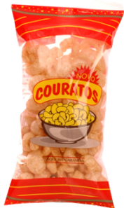
COUENNE DE PORC CHIPS (COURTOS) 50G SANZE