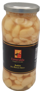
GROS HARICOTS BLANCS JUDION 560G ESMERALDA