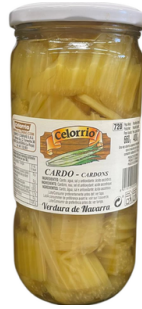
CARDONS NATUREL 400G CELORRIO