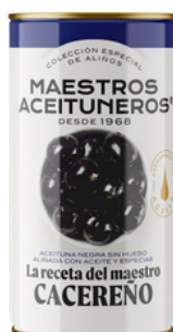
OLIVES NOIRES DENOYAUTEES 150G M. ACEITUNEROS