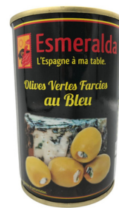
OLIVES VERTES FARCIES A LA PATE DE FROMAGE 120 G ESMERALDA