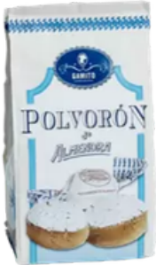
BOLSA POLVORON DE ALMENDRA 180G DULCES GAMITO