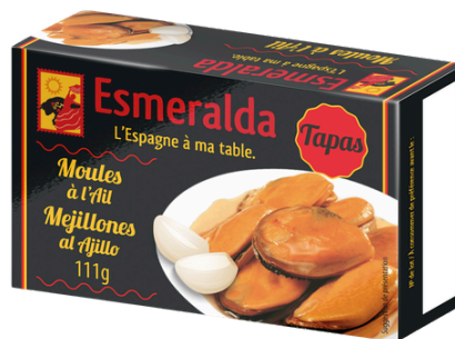
MOULES A L'AIL 116G ESMERALDA