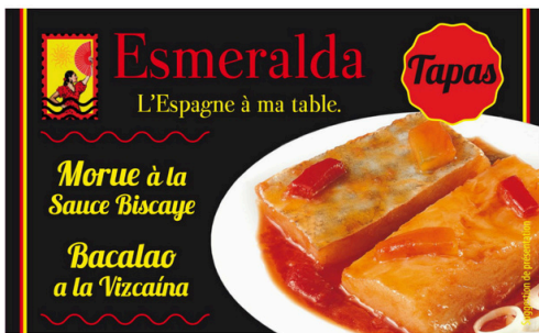
MORUE SAUCE BISCAYE 116G ESMERALDA