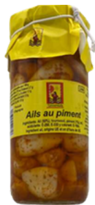
AILS AU PIMENT 230G ESMERALDA