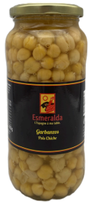
POIS CHICHES CUITS 560 G ESMERALDA