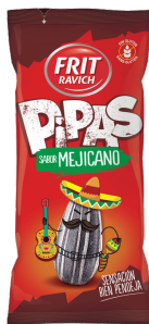
PIPAS MEXICAINES 130G FRIT RAVICH