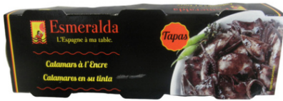
CALAMAR A L'ENCRE 3 X 80 G ESMERALDA