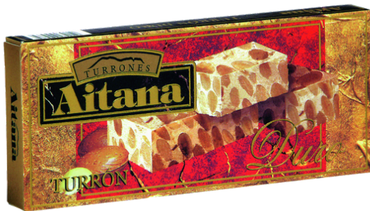
TURRON DUR ALICANTE AUX AMANDES GRILLEES 200G AITANA