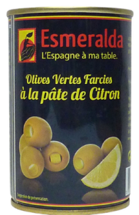
OLIVES VERTES FARCIES AU CITRON 120G ESMERALDA