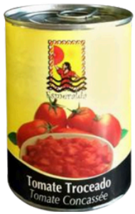
TOMATES CONCASSEES 390G ESMERALDA