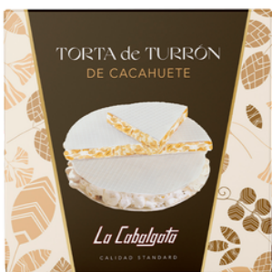
TORTA IMPERIAL TURRON DURO CACAHUETE 120G LA CABAGATA