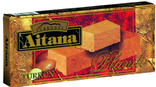
TURRON MOU DE JIJONA AUX AMANDES GRILLEES 200G AITANA BLANDO