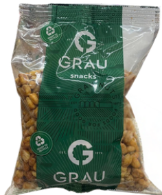
MAIS TENDRE GRILLE ET SALLE 250G GRAU