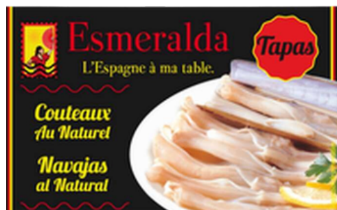
COUTEAUX AU NATUREL 116G ESMERALDA