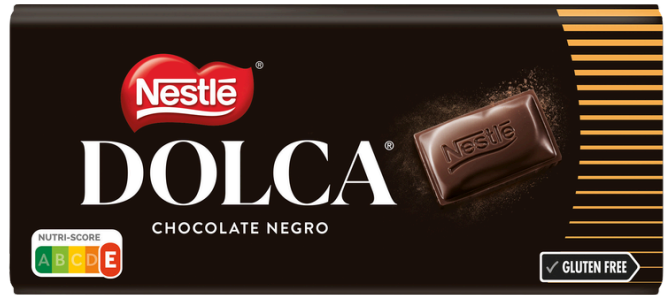
TABLETTE CHOCOLAT NOIR DOLCA 100G NESTLE