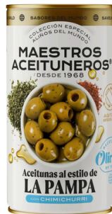
OLIVES VERTES DÉNOYAUTÉES ASSAISONNÉES AU CHIMICHURRI 150G M. ACEITUNEROS