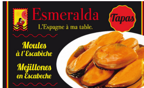
MOULES A L'ESCABECHE 116G ESMERALDA