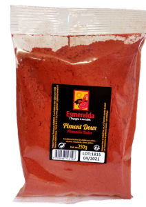
PIMENT DOUX 250G ESMERALDA