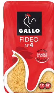
PATES FIDEO N°4 450G GALLO