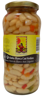
HARICOTS BLANCS AVEC LEGUMES 560G ESMERALDA