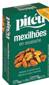
MOULES SAUCE MARINADE ESCABECHE PITEU 115G X 16 MEXILHOES