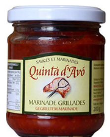
MARINADE POUR GRILLADES 200G - QUINTA D'AVO