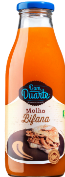
SAUCE POUR BIFANAS DOM DUARTE 500 G