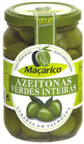
OLIVES VERTES ENTIERES 210G MACARICO