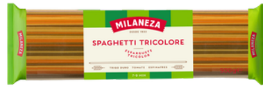
PATES SPAGHETTI TRICOLORE 500G MILANEZA