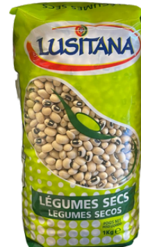
HARICOT CORNILLE SEC LUSITANA 1 KG