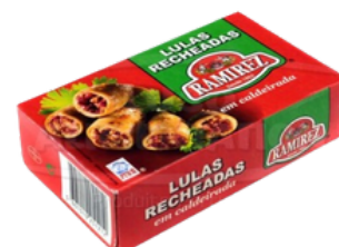
CALAMAR FARCI A LA PORTUGAISE RAMIREZ 120G