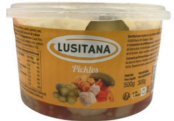
PICKLES LUSITANA BARQ. 300g