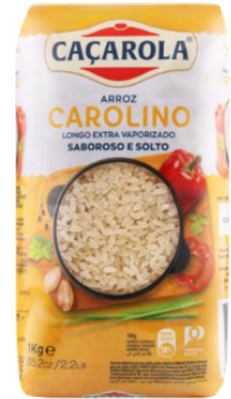
RIZ CACAROLA VAPORIZADO CAROLINO 1 KG