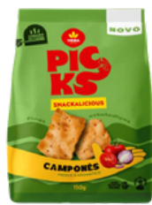
BISCUIT PICKS COUNTRY 150G VIEIRA DE CASTRO