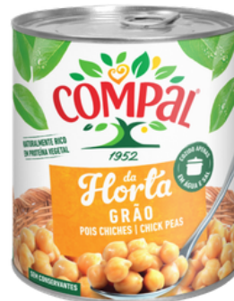
POIS CHICHES 845 GRS COMPAL