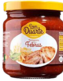
MARINADE POUR ESCALOPES DE PORC 200 GR DOM DUARTE