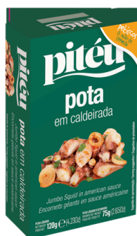
ENCORNET GEANT SAUCE AMERICAINE PITEU 115G