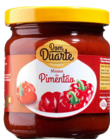
PATE DE POIVRON (MASSA DE PIMENTAO) 200G DOM DUARTE