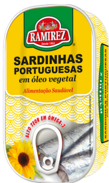
SARDINE HUILE VEGETALE 125G RAMIREZ