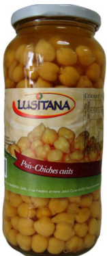
POIS CHICHES CUIITS 400G LUSITANA