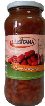
HARICOTS ROUGES CUIITS 400G LUSITANA