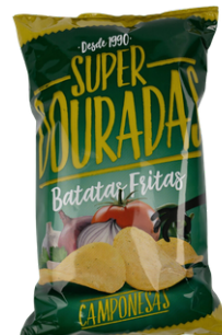
CHIPS SUPER DOURADAS RECETTE PAYSANNE "CAMPONESA" 150G