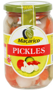
PICKLES FLACON PETIT MACARICO 210G