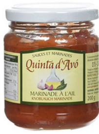
MARINADE D'AIL 200G - QUINTA D'AVO