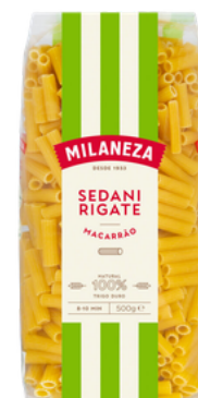
PATES MACARRAO SEDANI RIGATE 500G MILANEZA