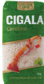
RIZ CIGALA CAROLINO 1KG