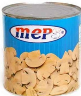
CHAMPIGNON DECOUPES MEPS 780G