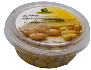
LUPINS A L'HUILE D'OLIVE AIL ET ORIGAN MACARICO BARQ. PLAST. 150G