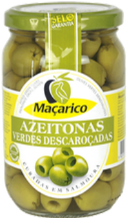
OLIVES VERTES DÉNOYAUTÉES MACARICO 291/320 165G