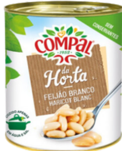
HARICOTS BLANCS 845 GRS COMPAL