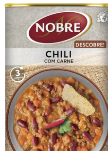
CHILI COM CARNE 420G NOBRE