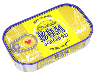
THON HUILE VEGETALE 120G BOM PETISCO X 100