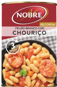
CHORIZO AUX HARICOTS 420G NOBRE