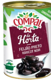
HARICOT NOIR CUIT COMPAL 410G