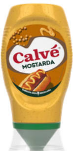
MOUTARDE CALVE TOP DOWN 257G