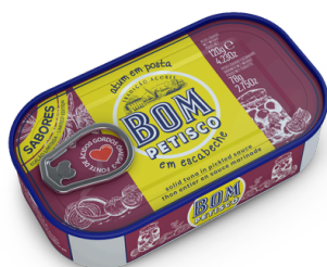
THON SAUCE A L'ESCABECHE 120G BOM PETISCO X 30