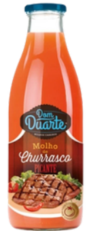
SAUCE POUR BARBECUE PIQUANTE 500G DOM DUARTE