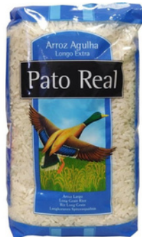
RIZ PATO REAL AGULHA 1KG