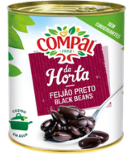
HARICOTS NOIRS CUIITS 845 G. COMPAL