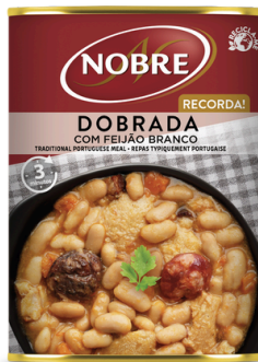
DOBRADA AVEC HARICOTS 420G NOBRE