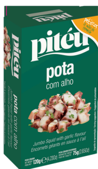
ENCORNET GEANT A L'AIL PITEU 120G