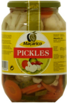
PICKLES BOCAL 500g MACARICO