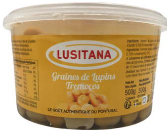
LUPINS LUSITANA BARQ. 300g CAL 12/13