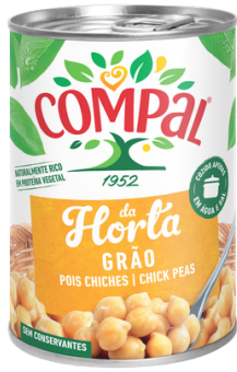
POIS CHICHE CUIT COMPAL 410G