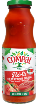
PULPE DE TOMATE 500G COMPAL