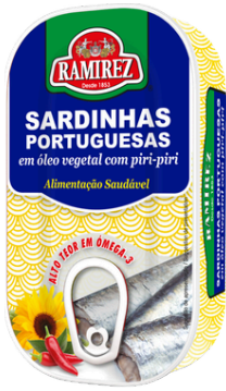
SARDINE HUILE VEGETALE PIQUANTE 125G RAMIREZ