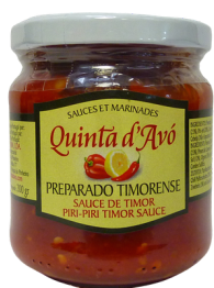
PÂTE DE PIRI-PIRI À L'ANCIENNE 200G - QUINTA D'AVO