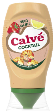
SAUCE COCKTAIL CALVE TOP DOWN 258G