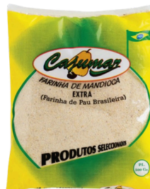
FARINHA MANDIOCA 500G CAJUMAR