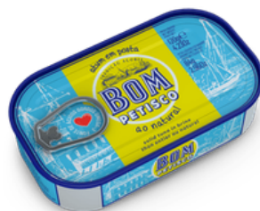
THON AU NATUREL BOM PETISCO 120G