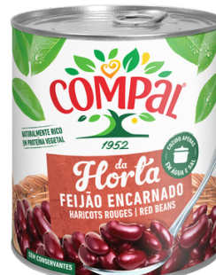
HARICOT ROUGE CUIT COMPAL 410G