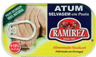
THON HUILE VEGETALE 120G RAMIREZ