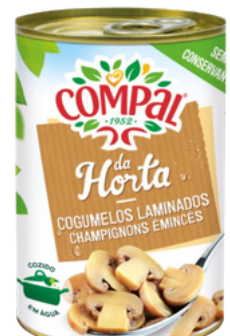
CHAMPIGNON DECOUPE 290G COMPAL