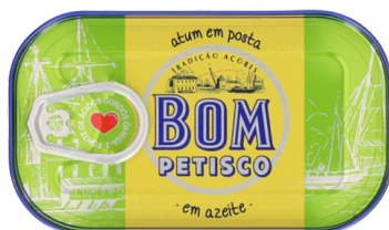
THON A L'HUILE D'OLIVE BOM PETISCO 120G x 50