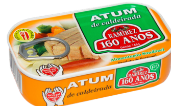
THON A LA PORTUGAISE 120G RAMIREZ