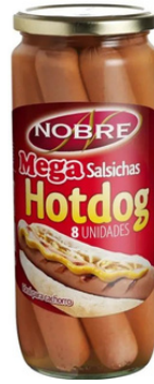
SAUCISSES NOBRE "MEGA" HOT DOG 700G