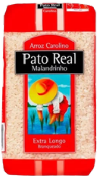
RIZ PATO REAL EXTRA LONG MALANDRINHO 1KG