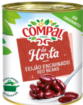
HARICOTS ROUGES 845 GRS COMPAL