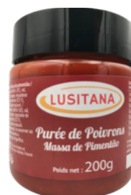
PUREE DE POIVRONS 200G LUSITANA