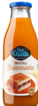
SAUCE POUR FRANCESINHAS DOM DUARTE 1KG