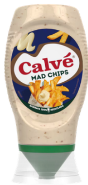
SAUCE FRITES MAD CHIPS CALVE TOP DOWN 260G