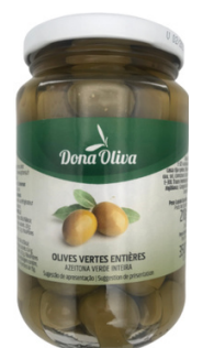
OLIVES VERTES ENTIERES 210g DONA OLIVA