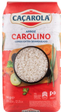
RIZ CACAROLA CAROLINO 1KG