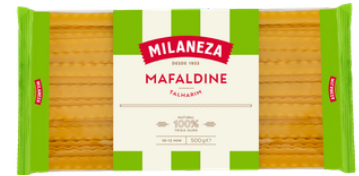
PATES TALHARIM 500G MILANEZA