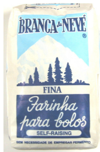
FARINE 1KG BRANCA DE NEVE