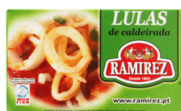
CALAMAR A LA PORTUGAISE RAMIREZ 120G - 4 X 12 (LULAS DE CALDEIRADA)