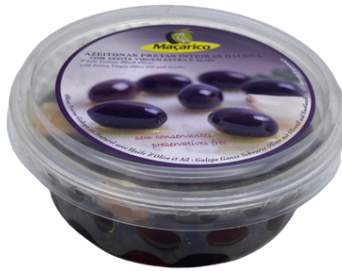
OLIVES NOIRES ENTIÈRES GALEGA AVEC HO ET A L'AIL BARQ.PLASTIQUE 150G