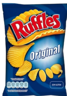
CHIPS MATUTANO RUFFLES ORIGINAL 160G