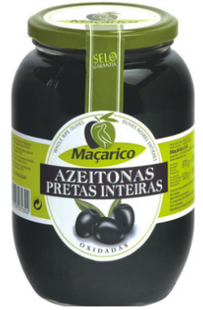
OLIVES NOIRES BOCAL 520g MACARICO