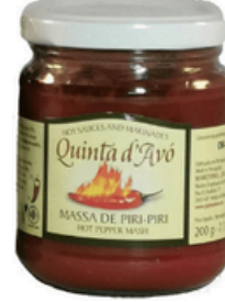
MARINADE PIRI PIRI 200G - QUINTA D'AVO