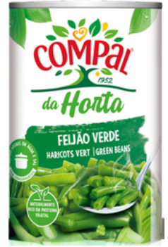
HARICOT VERT CUIT COMPAL 410G