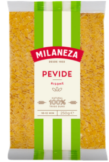
PATES PEVIDE 250G MILANEZA