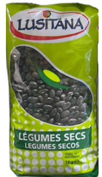
HARICOT NOIR SEC LUSITANA 1KG