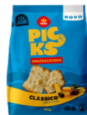
BISCUIT PICKS CLASSIC 180G VIEIRA DE CASTRO