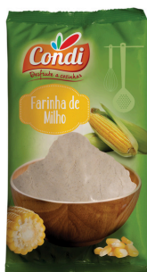
FARINE MAIS BLANCHE 500G CONDI