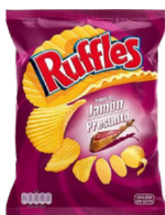
CHIPS MATUTANO RUFFLES JAMBON FUME 150G