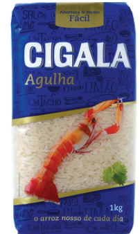
RIZ CIGALA AGULHA 1KG