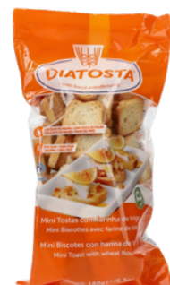
TOAST DIATOSTA 350g