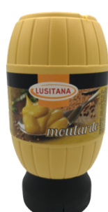
MOUTARDE LUSITANA 270G