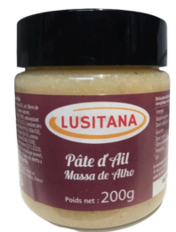
PATE D'AIL 200G LUSITANA