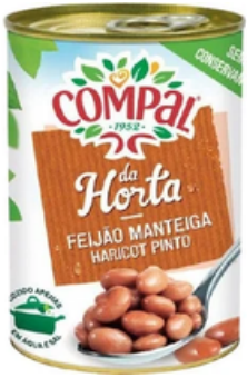
HARICOT BEURRE CUIT COMPAL 410G