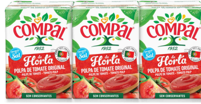
PULPE DE TOMATE COMPAL 3x210G