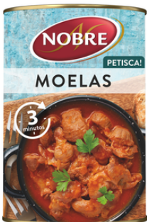
GESIERS "MOELAS" NOBRE 420G