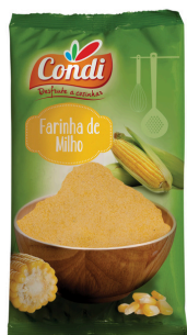
FARINE MAIS JAUNE 500G CONDI