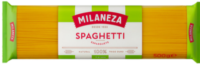
PATES SPAGHETTI 500G MILANEZA