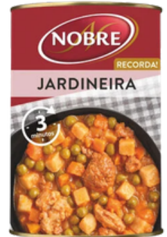
JARDINEIRA NOBRE 420G