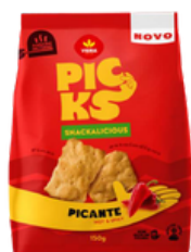
BISCUIT PICKS PIQUANT 150G VIEIRA DE CASTRO