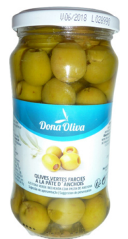
OLIVES VERTES FARCIES A LA PATE D'ANCHOIS 200g DONA OLIVA