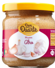
PATE D'AIL (MASSA DE ALHO) 200G DOM DUARTE