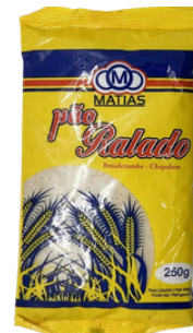
CHAPELURE DE PAIN 250G MATIAS