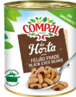
HARICOTS CORNILLES 845 GRS COMPAL