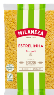
PATES ESTRELINHAS 250G MILANEZA