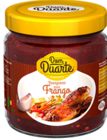
MARINADE POUR POULET 200G DOM DUARTE