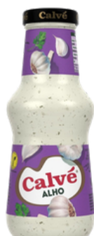
SAUCE A L'AIL CALVE 259G