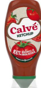
KETCHUP CALVE TOP DOWN 275G