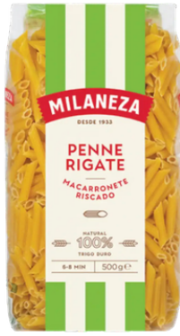
PATES MACARRONETE RISCADO 500G MILANEZA