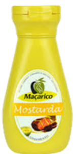
MOUTARDE 250g MACARICO