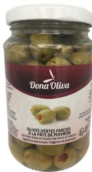
OLIVES VERTES FARCIES A LA PATE DE POIVRON 200g DONA OLIVA