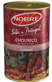
CHORIZO A L'HUILE 4/4 700 G NOBRE