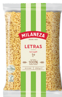
PATES LETRAS 250G MILANEZA