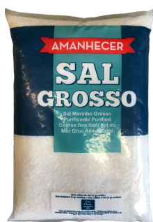
SEL MARIN CRISTAL AMANHECER 1KG