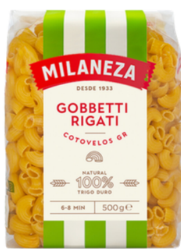
PATES COTOVELOES GOBETTI RIGATTE (GROSSE COQUILLETTE STRIÉE) 500G MILANEZA