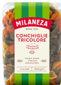
PATES CONCHAS TRICOLERE 500G MILANEZA