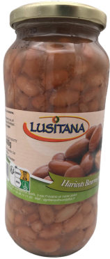
HARICOTS BEURRE CUIITS 400G LUSITANA