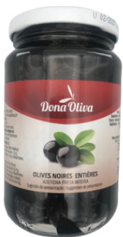
OLIVES NOIRES ENTIERES 210g DONA OLIVA