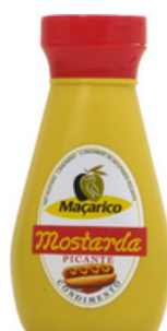
MOUTARDE PIQUANTE 250g MACARICO