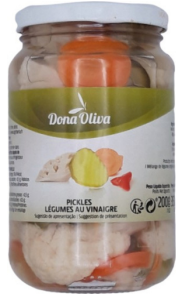
PICKLES PETIT FLACON 200g DONA OLIVA