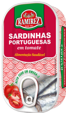
SARDINE TOMATE 125G RAMIREZ