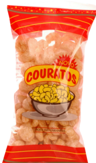
COUENNE DE PORC CHIPS (couratos) 50G SANZE