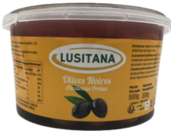
OLIVES NOIRES LUSITANA BARQ. 300g