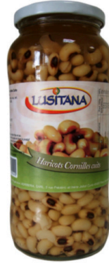
HARICOTS CORNILLES CUIITS 400G LUSITANA