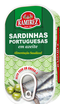
SARDINE HUILE OLIVE 125G RAMIREZ