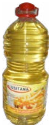
HUILE VEGETALE FRITURE 3L LUSITANA