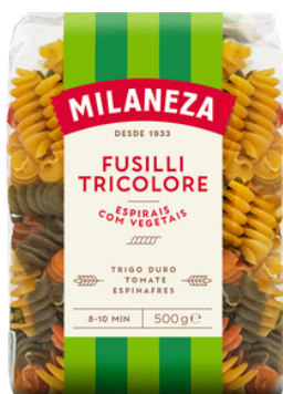
PATES FUSILLI TRICOLERE "ESPIRAIS" 500G MILANEZA