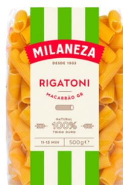
PATES MACARRAO GR RIGATONI 500G MILANEZA