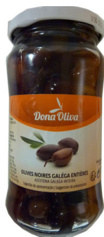
OLIVES GALEGA ENTIERES 210g DONA OLIVA