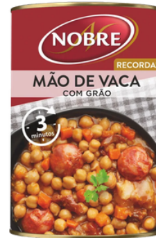
PIEDS DE BOEUF AUX POIS CHICHES 420 G NOBRE