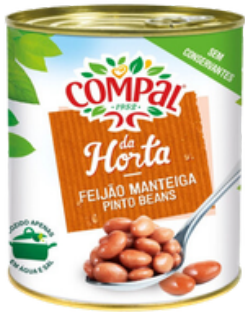
HARICOTS BEURRE 845 GRS