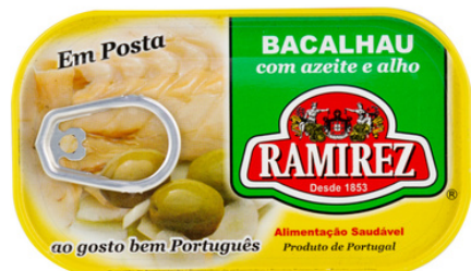
MORUE HUILE D'OLIVE ET AIL 120G RAMIREZ