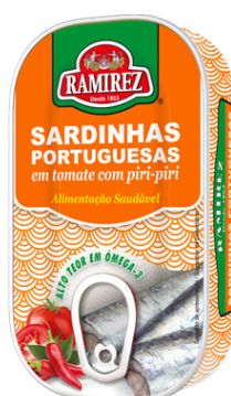
SARDINE TOMATE PIQUANTE 125g RAMIREZ