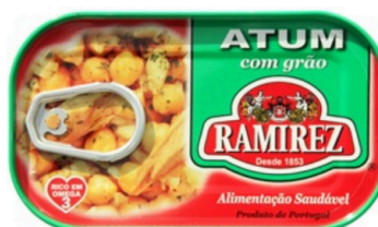
SALADE DE THON AUX POIS CHICHE 120G RAMIREZ