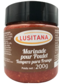
MARINADE POUR POULET 200G LUSITANA