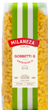
PATES COTOVELOES GOBETTI (GROSSE COQUILLETTE LISSE) 500G MILANEZA