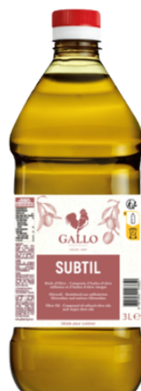
HUILE D'OLIVE GALLO SUBTIL 3L FR RAFINE 0.1% PET