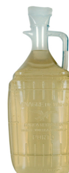
VINAIGRE DE VIN 50CL VINORTE