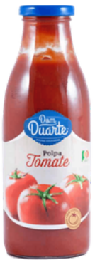
PULPE DE TOMATE 500 GR DOM DUARTE