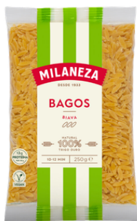
PATES BAGOS 250G MILANEZA