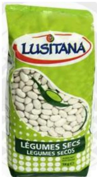
HARICOT BLANC SEC LUSITANA 1 KG