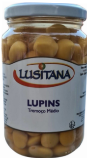
LUPINS LUSITANA BOCAL VERRE 235G N.E