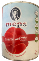
TOMATES PELEES 780G MEPS