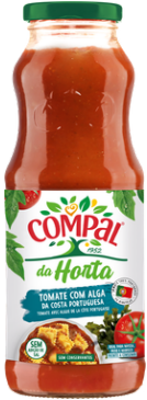
SAUCE TOMATE AVEC DES ALGUES 500G COMPAL