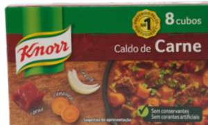
BOUILLON KNORR VIANDE 24 X 8 CUBES 80G