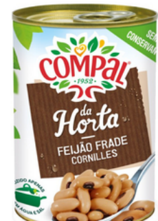
HARICOT CORNILLE CUIT COMPAL 410G