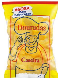
CHIPS DOURADAS RECETTE RUSTIQUE 200G