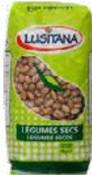
HARICOT COCO ROSE SEC LUSITANA 1 KG