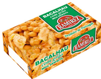
MORUE ET POIS CHICHE A HUILE OLIVE EXTRA VIERGE 120G RAMIREZ