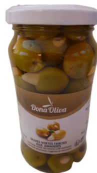
OLIVES VERTES FARCIES AUX AMANDES 200g DONA OLIVA