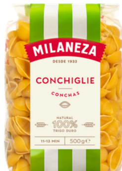
PATES CONCHAS 500G MILANEZA