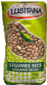
HARICOT BEURRE SEC LUSITANA 1KG