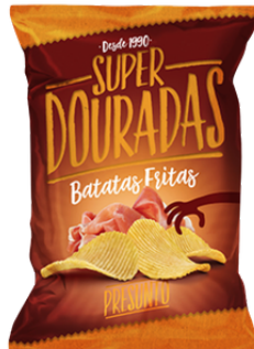
CHIPS SUPER DOURADAS JAMBON FUME 150G