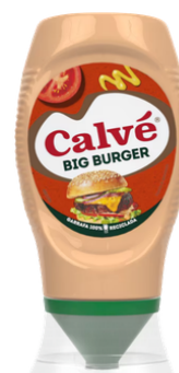
SAUCE BIG BURGER CALVE TOP DOWN 260G