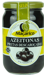
OLIVES NOIRE DENOYAUTE 291/320 VB2 MACARICO 165G