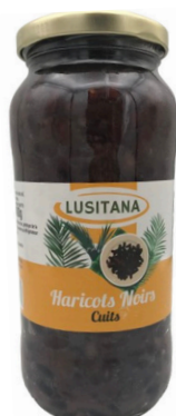
HARICOTS NOIRS CUIITS 400G LUSITANA