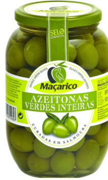
OLIVES VERTE BOCAL 520g MACARICO