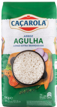
RIZ CACAROLA AGULHA 1KG