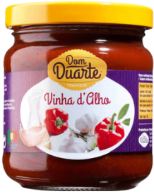
MARINADE A L'AIL, VIN, LAURIER, PIMENT 200G DOM DUARTE