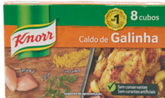
BOUILLON KNORR POULET 24 X 8 CUBES 80G