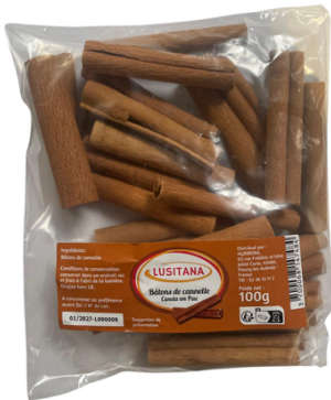
BATONS DE CANNELLE 100G LUSITANA