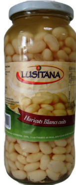
HARICOTS BLANCS CUIITS 400G LUSITANA