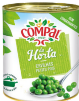
PETITS POIS CUIITS 845G COMPAL