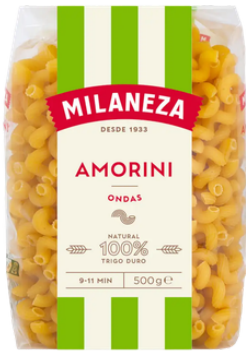
PATES ONDAS MILANEZA 500GR