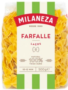
PATES LACOS MILANEZA 500GR