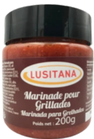
MARINADE POUR GRILLADES 200G LUSITANA