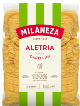
PATES ALETRIA 500G MILANEZA