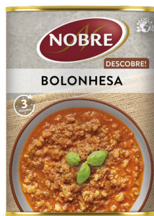
BOLONHESA 420G NOBRE