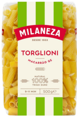
PATES MACARRAO TORTIGLIONI GE 500G MILANEZA