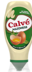
MAYONNAISE CALVE TOP DOWN 240G