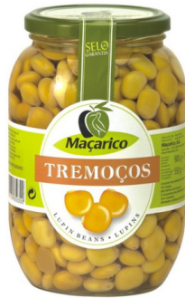
LUPINS CUIITS BOCAL 550g MACARICO