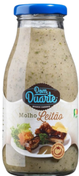
SAUCE POUR COCHON DE LAIT "DOM DUARTE" 500g