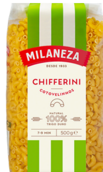
PATES COTOVELINHOS (COQUILLETTE) 500G MILANEZA