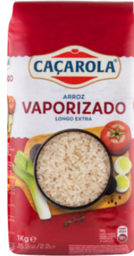
RIZ CACAROLA VAPORIZADO 1KG