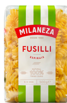
PATES FUSILLI "ESPIRAIS" 500G MILANEZA