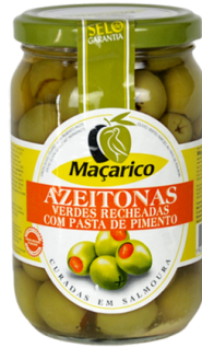
OLIVES VERTE FARCIES AUX POIVRONS 341/360 VB2 MACARICO 200G