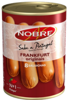
SAUCISSES 350g Net/200g Net Egouté NOBRE