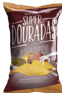
CHIPS SUPER DOURADAS ONDULE COCHON DE LAIT 150G