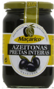
OLIVES NOIRES ENTIERES 210G MACARICO