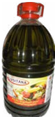
HUILE ASSAIS. VEG./OLIVE LUSITANA - 5L