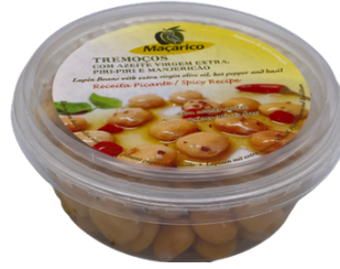
S AVEC HUILE D'OLIVE, PIMENT PIQUANT ET BASILIC BARQ. PLASTIQUE 150G