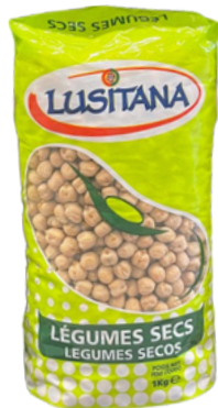
POIS CHICHES SEC LUSITANA 1 KG