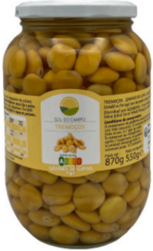
LUPINS SOL DO CAMPO BOCAL 550g