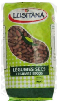
HARICOT ROUGE SEC LUSITANA 1KG