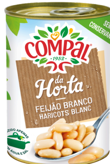
HARICOT BLANC CUIT COMPAL 410G