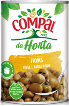
FEVES CUIT COMPAL 410G