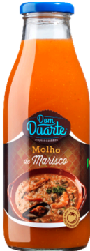
SAUCE POUR RIZ FRUITS DE MER 500G DOM DUARTE