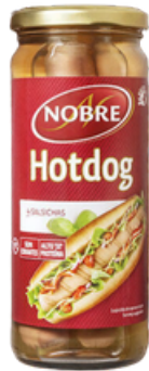
SAUCISSES HOT DOG NOBRE FRA4 210G