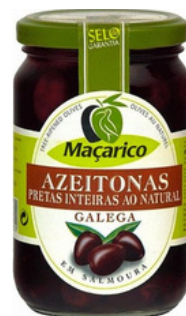
OLIVES GALEGA 30/40 VB2 MACARICO 210 G