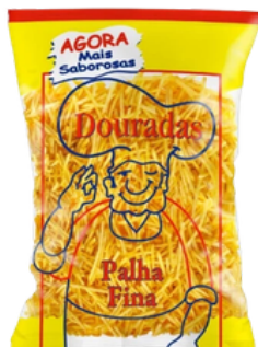
CHIPS - FRITES PAILLE 500G DOURADAS