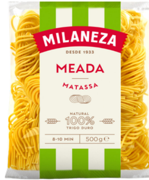
PATES MEADA 500G MILANEZA