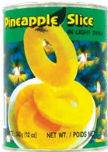
Ananas en tranches au sirop 565 g Cock