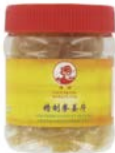
Gingembre confit Coq 180 G