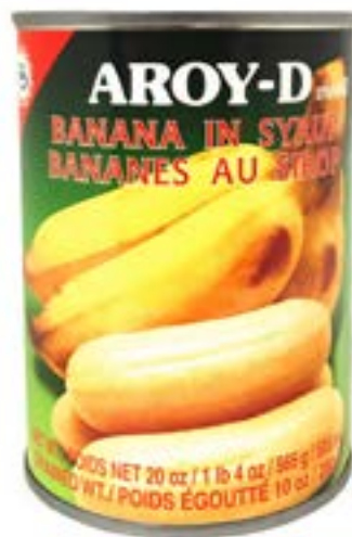
Bananes au sirop 565 g Aroy D