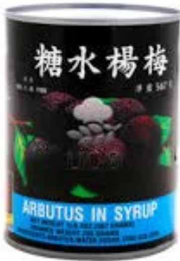
Arbouses au sirop 567 G Coq