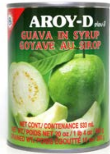
Goyave au sirop 565 g Aroy D