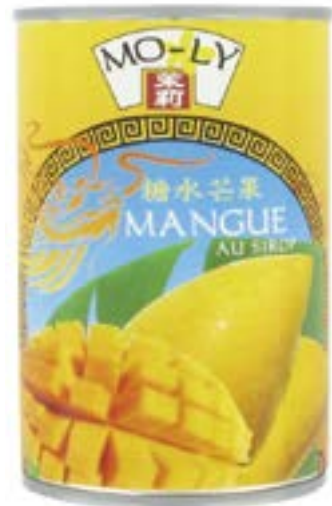
Mangué au sirop Mo Ly 425 G