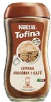
TOFFINA 200 g NESTLE