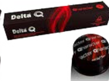
CAPSULE CAFE qcharacter 60 g N° 9 POUR MACHINE DELTA