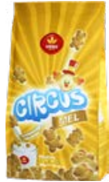
BISCUIT CIRCUS AU MIEL 300g VIEIRA DE CASTRO