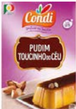
PREPARATION P/FLAN TOUCINHO DO CEU 200G CONDI