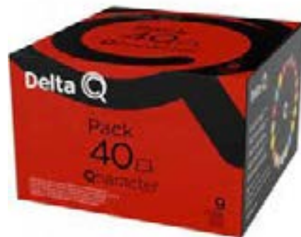
PACK XL 40 CAPSULES CAFE QHA- RACTER N° 9 POUR MACHINE DELTA 60g