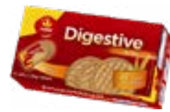
BISCUIT DIGESTIVE DOSE 258 G VIEIRA DE CASTRO