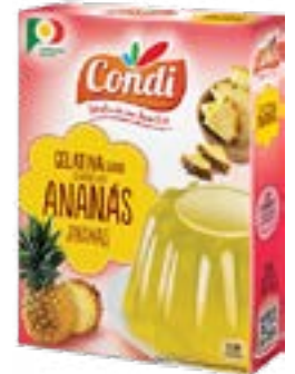
PREPARATION P/GELATINE ANANAS CONDI 2x85G