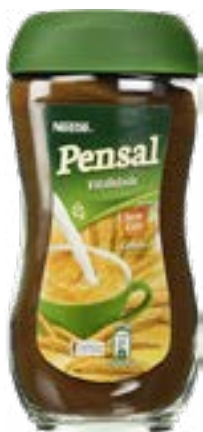
CEVADA PENSAL 200G NESTLE