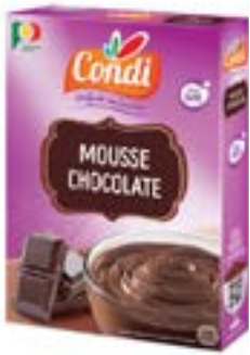
PREPARATION P/MOUSSE AU CHOCOLAT CONDI 150G