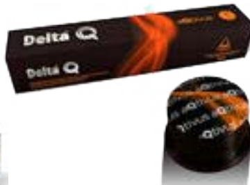
CAPSULE CAFE aqtivus 60 g N° 8 POUR MACHINE DELTA