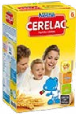
CERELAC 500G NESTLE