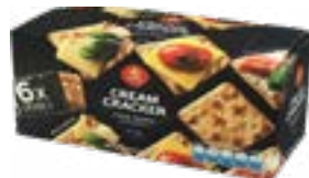
BISCUIT CREAM CRACKER (6x30G) 180G VIEIRA DE CASTRO