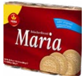
BISCUIT MARIA PACK 4X 200G VIEIRA DE CASTRO