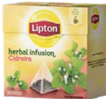
THE MELISSE - CIDREIRA 20 SACHETS x 1 g soit la Boîte 20g LIPTON