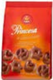
ASSORTIMENT BISCUIT AU CHOCOLAT PRINCESA 200G VIEIRA DE CASTRO