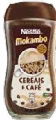
CAFE MOKAMBO 200G NESTLE