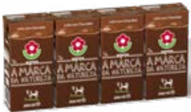
LAIT CHOCOLATE BRICK 4 x 200ML AGROS