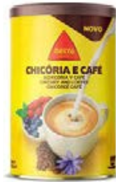
CHICOREE CAFE DELTA SO- LUBLE 250G