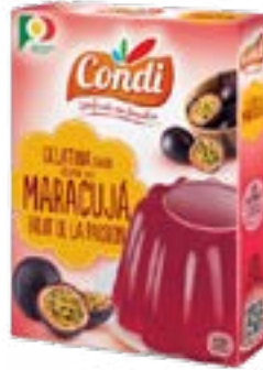
PREPARATION P/GELATINE PASSION CONDI 2x85G