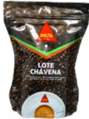
CAFE EN GRAIN CHAVENA 250g DELTA