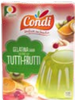
PREPARATION P/GELATINE MULTI-FRUITS CONDI 2x85G