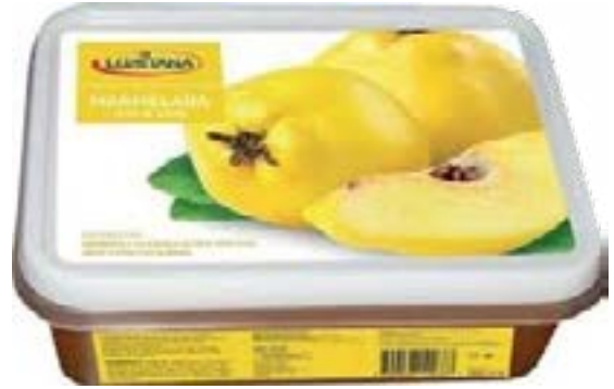
MARMELADE DE COING 450G LUSITANA