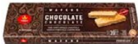
GAUFRETTE SAVEUR CHOCO- LAT VIEIRA DE CASTRO 150 G