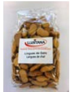
BISCUIT LANGUE DE CHAT LUSITANA 250G