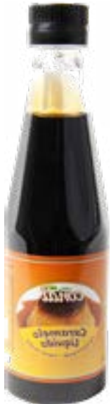
CARAMEL LIQUIDE 400ML CONDI