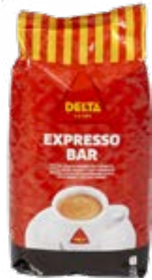
CAFE DELTA EXPRESSO BAR 1kg