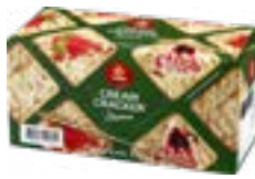
BISCUIT CREAM CRACKER SESAME VIEIRA DE CASTRO DOSE 186G