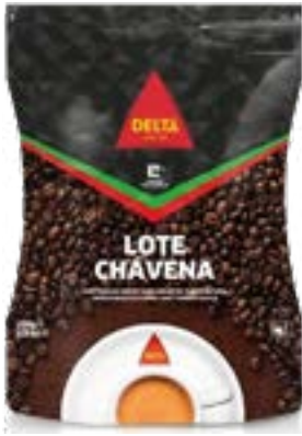
CAFE MOULU CHAVENA 250g DELTA