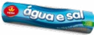
BISCUIT AGUA & SAL 125G VIEIRA DE CASTRO