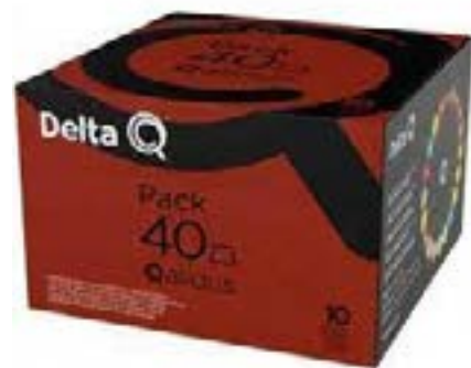
PACK XL 40 CAPSULES CAFE QUALI- DUS N° 10 POUR MACHINE DELTA 60g