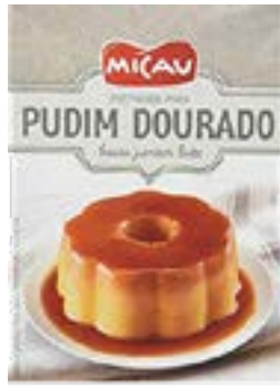
PREPARATION POUR PUDIM DOURADO 200G MICAU