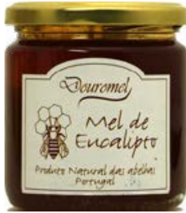
MIEL EUCALYPTUS POT 300g DOUROMEL