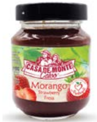
CONFITURE DE FRAISE CASA DE MONTE CALVO 340G