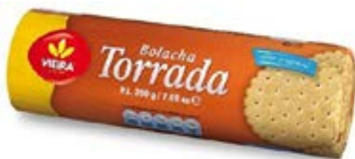
BISCUIT TORRADA 200G VIEIRA DE CASTRO