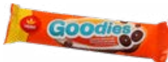
BISCUIT GOODIES CHOCOLAT AU LAIT 150G VIEIRA DE CASTRO