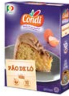
PREPARATION POUR PAO DE LO 435G CONDI