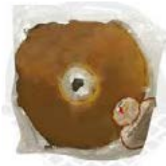
PAO DE LO 300 G LUSITANA