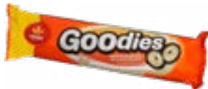
BISCUIT GOODIES CHOCOLAT BLANC 150G VIEIRA DE CASTRO