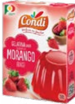
PREPARATION P/GELATINE FRAISE CONDI 2x85G