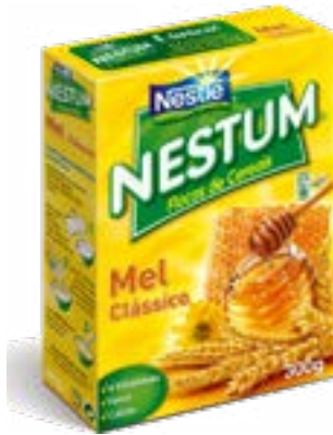
NESTUM MIEL 300g NESTLE