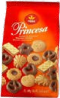
BISCUIT ASSORTIMENT PRINCESA 400G VIEIRA DE CASTRO