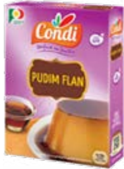
PREPARATION POUR FLAN AUX OEUFS CONDI 120G