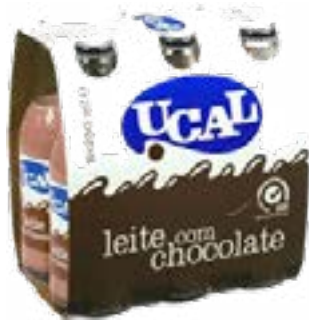
LAIT CHOCOLATE 6x250ML UCAL