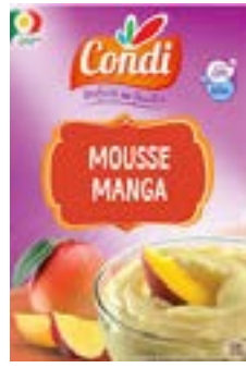
PREPARATION POUR MOUSSE A LA MANGUE CONDI 80G