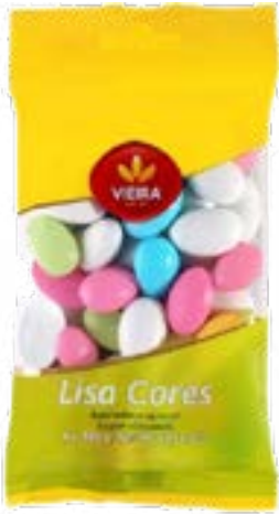
DRAGEES LISA CORES 200G VIEIRA DE CASTRO .TVA 20%