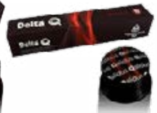
CAPSULE CAFE 60g quali- dus N° 10 POUR MACHINE DELTA