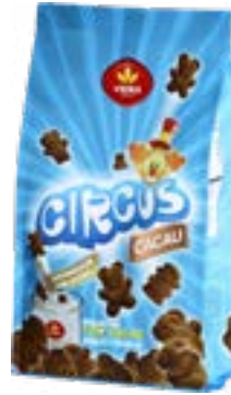
BISCUIT CIRCUS AU CHOCOLAT 300g VIEIRA DE CASTRO