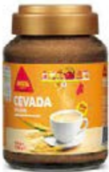
CEVADA DELTA « ORGE SO- LUBLE» 200G