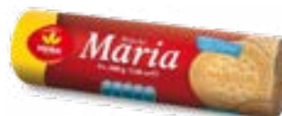
BISCUIT MARIA 200G VIEIRA DE CASTRO