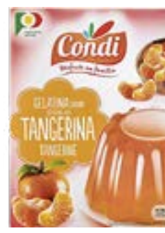
PREPARATION P/GELATINE MANDARINE CONDI 2x85G