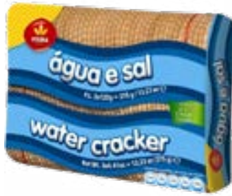
BISCUIT AGUA & SAL TRIPACK (3X 125 G) VIEIRA DE CASTRO