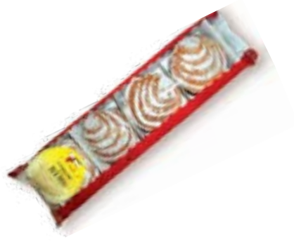
CAVACAS 400G PASTELARIA DO CASTELO