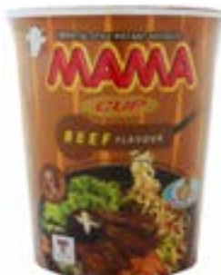
Soupe saveur bœuf 70 g cup Mama