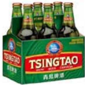
Bière Tsingtao 4,7 ° 6 X 330 ML