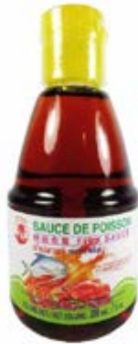
Sauce poisson Coq 200 ml