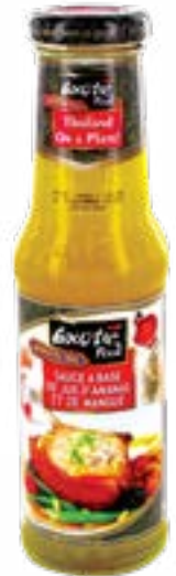
Sauce à la mangue et à l'ananas 250 ml Exotic Food