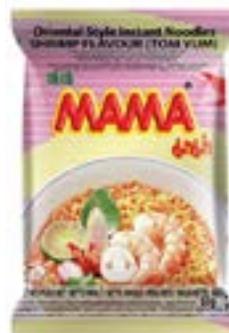
Soupe saveur crevette sachet 85 g TOM YUM