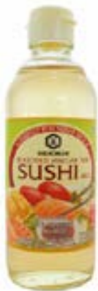
Vinaigre sushi 200 ml Yummito