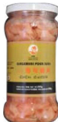
Gingembre pour sushi 340 G