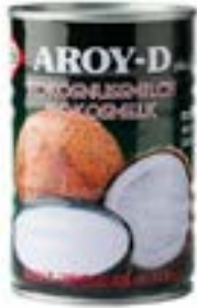
Lait coco 165 ml Aroy D