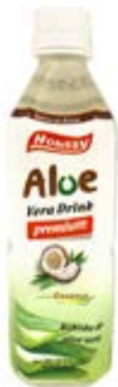
Boisson aloe vera et coco 500 ml Houssy