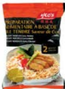
Soupe saveur curry sachet 85 g Yeo's