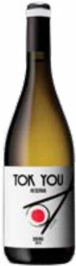
VIN SUSHI TOK YOU 13° DOURO RESERVE WHITE 2015 75CL