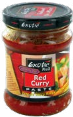
Pâté purée curry rouge 220 g Exotic