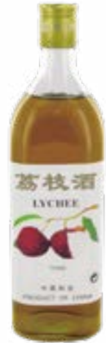
Liqueur aux lychees 13,5° 750 ml Cock