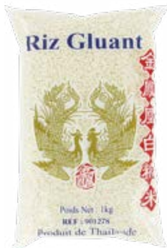
Riz gluant Phenix D'or 1 KG