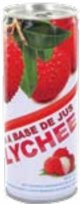
Boisson aux lychees Coq 250 ml