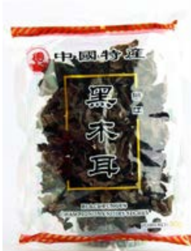
Champignons noirs Coq 80 G