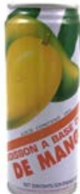
Boisson à la mangue 250 ml Coq