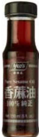
Huile de sésame 150 ml Yeo