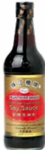
Sauce soja supérieure 150 ml PRB