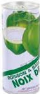
Boisson noix de coco 250 ml Coq