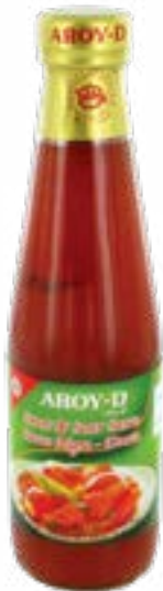
Sauce aigre douce Aroy D 280 ml