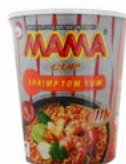
Soupe saveur tom yum (crevettes piquantes) 70 g cup Mama