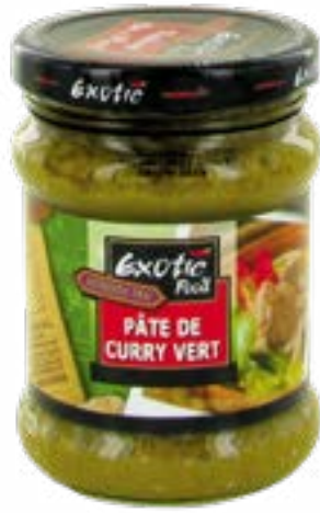
Pâté purée curry vert 220 g Exotic