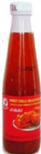
Sauce piment volaille 350g Coq