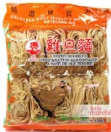
Nouilles chinoises fines aux œufs 454 g