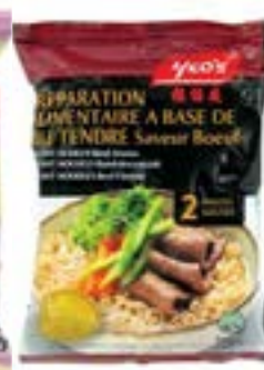
Soupe saveur bœuf sachet 85 g Yeo's