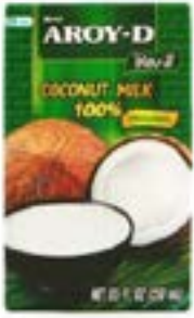
Extrait de coco UHT 250 ml Aroy D