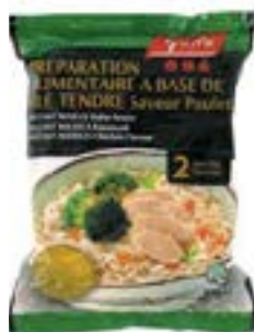
Soupe saveur poulet sachet 85 g Yeo's