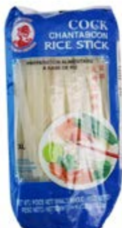
Vermicelles de riz 3 mm 375 g Bun Tuoi