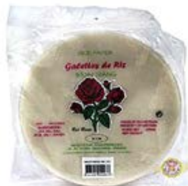
Galette de riz rose 454 G Dia- mètre 22 cm