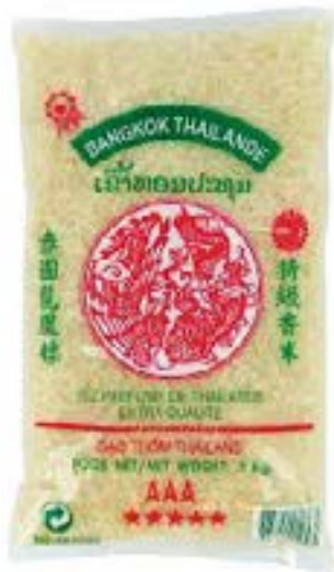
Riz parfumé Dragon Phenix 1 KG