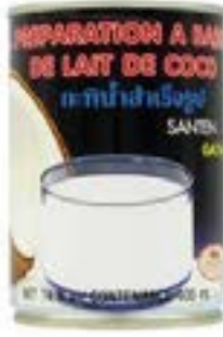
PREPARATION DE LAIT DE COCO GLOBE 400 ML