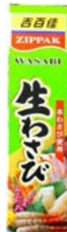
Sauce wasabi 43 Zippak