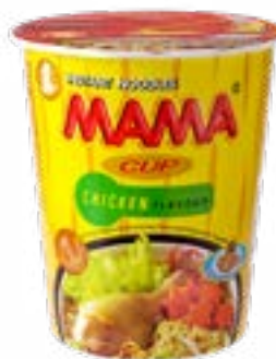
Soupe saveur poulet 70 g cup Mama