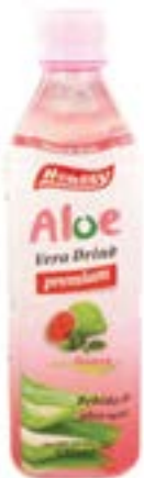
Boisson aloe vera et goyave 500 ml Houssy