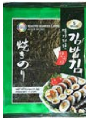
Algues grillées Sukrina (5 feuilles) 12 G