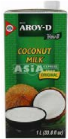
Lait de coco UHT 1 L Aroy D