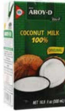
Lait de coco 500 ml en brique Aroy D