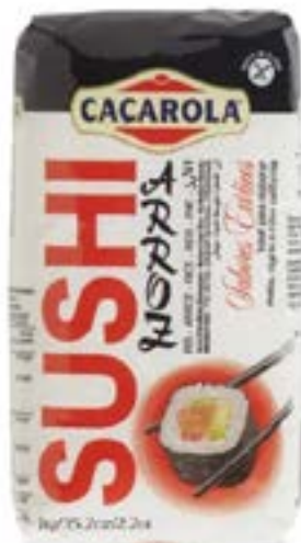
Riz pour sushi Cacarola 1 kg