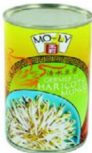
Germe de haricots Mungo Mo Ly 400 G