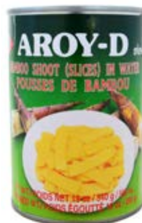
Pousses de bambou en tranche 567g