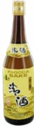
Sake chinois 16° 75 CL