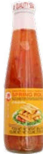
Sauce pour roulé de printemps (spring roll) 275 ml Coq