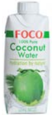
Eau de coco nature 330 ml Foco