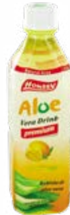
Boisson aloe vera et mangue 500 ml Houssy