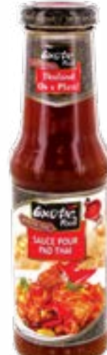
Sauce pour pad thai 250 ml Exotic Food