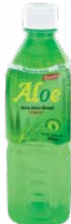
Boisson aloe vera origi- nal 500 ml Houssy