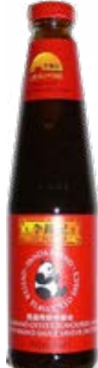
Sauce huître 255 g Jin Pai