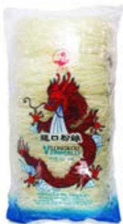
Vermicelles Longkou 100 g Mo Ly